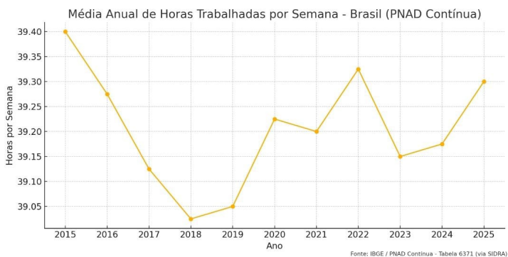
Gráfico 1 – Média de horas trabalhadas por Semana – Brasil.