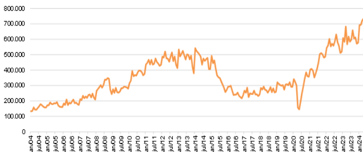
Gráfico 1 - Pedidos de demissão no Brasil de Janeiro/2004 a Maio/2024.